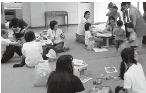
「ちょっとここで一休みの会」の様子

があります。震災直後のストレスもありますが、これから冬に向けてストレスを抱える人も多いことが予想されます。ストレスを吐き出す場として、この活動は細く長く続けなければならぬと思っています。今回の地元での震災に対して「何かしたい」「何かできないか」と考えている方は是非お声をかけてください。 (つむらや よしたか)