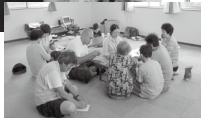
相馬市の仮設住宅にて行っている「いつもここで一休みの会」