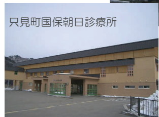
只見町国保朝日診療所