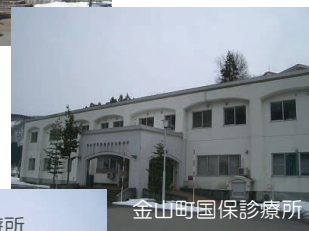
金山町国保診療所