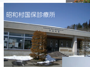
昭和村国保診療所