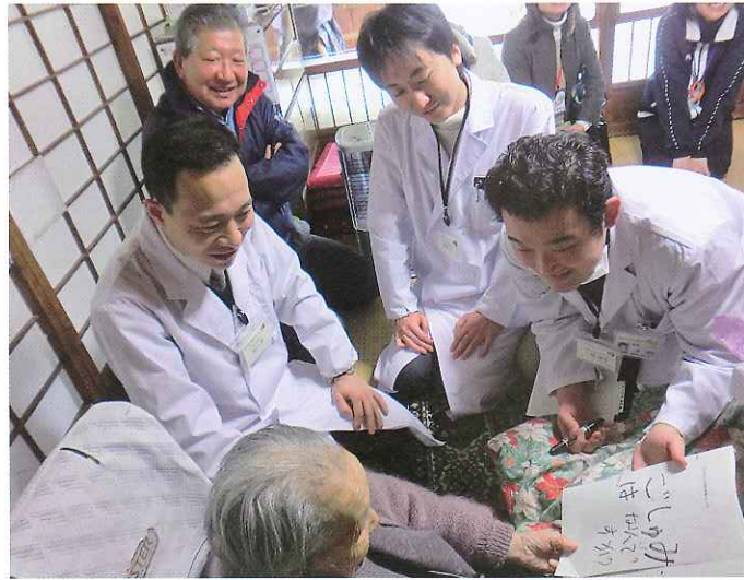
訪問診療同行 (矢祭町にて)