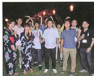
地域住民との交流