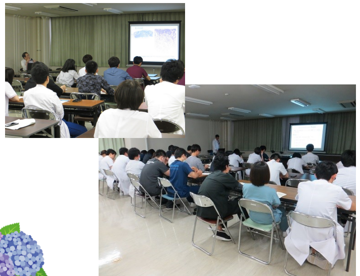
ステップ・アップ・セミナーの様子