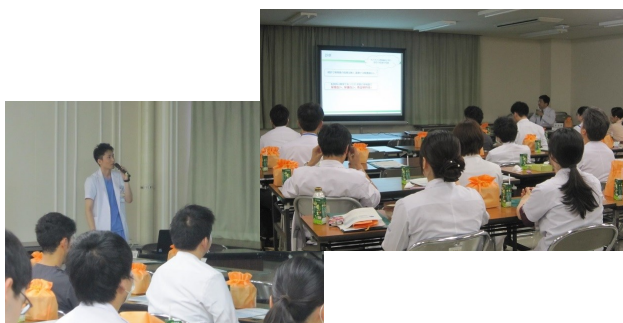
ステップアップセミナーの様子