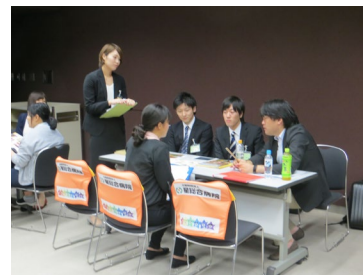
■個別説明・相談会