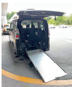
(車椅子対応無料送迎車)