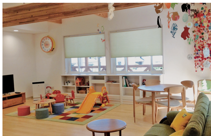
パンダハウス内リビング