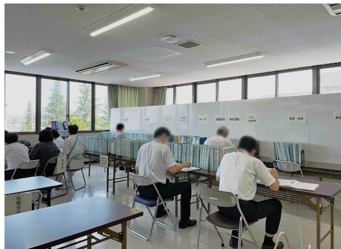
②会議・委員会などに関する審査