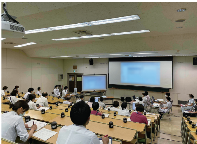
①医療サービスに関する審査

これからも患者さんの声や病院機能評価の受審などを踏まえ、当院の基本理念である「健康を支える医療・心温まる医療」を目指して、県民の皆様と共に歩んでまいります。