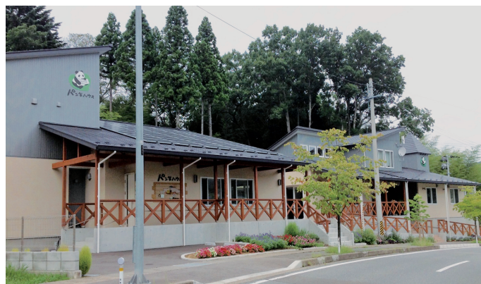
パンダハウス外観