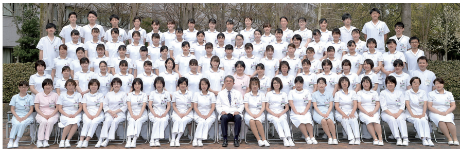
今年度新採用・転入看護師さんと一緒に

んが受診されます。さらに日々約600名を超える患者さんが入院されていらっしゃいます。患者さんは病という敵と日々戦っておられます。私達は患者さんの病気を治療することはもちろん、傷ついた心とも真摯に向き合い、寄り添っていきたくと考えております。当院の基本理念は「健康を支える医療・心温まる医療を目指して県民と共に歩む」ことであり、病院の合言葉は「誰からも選ばれる明るい病院、みんなが集まるみんなのための病院」です。これらの理念を実践するために、約600名の医師、約870名の看護師、約500名の技師、事務職員が垣根を越え、心と力を合わせて患者さんのために日々がんばっています。今後もたゆまない努力と研鑽を続けて参りますので、どうぞよろしく願います。