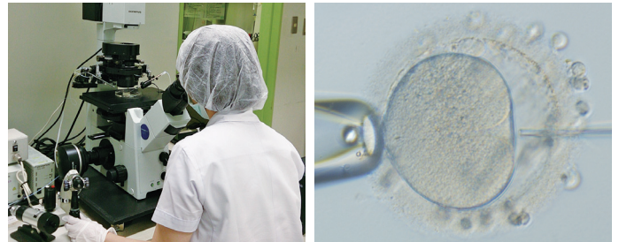
卵細胞質内精子注入法（ICSI）の実施風景 顕微授精用マイクロマニピュレーションシステム