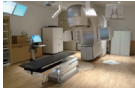
治療室 A に設置された最新型ライナック

有害事象 (副作用) の減少が期待できます。適応疾患など、お気軽に放射線治療科までご相談ください。