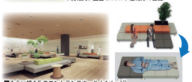
■みらい棟1Fのエントランスホール(イメージ) ベンチはベッドに変形しトリアージに対応可