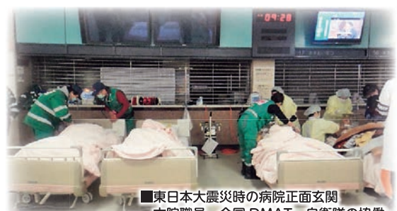
■東日本大震災時の病院正面玄関 本院職員、全国DMAT、自衛隊の協働

福島県立医科大学附属病院は、今後も基幹災害拠点病院として福島県の災害医療をリードしてまいります。