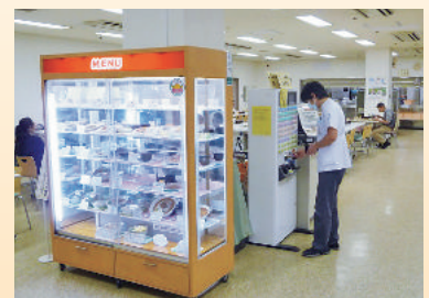
あなたが病院食堂に求めるもの

年代別：10代2%、20代16%、30代22%、 40代20%、50代14%、60代26%