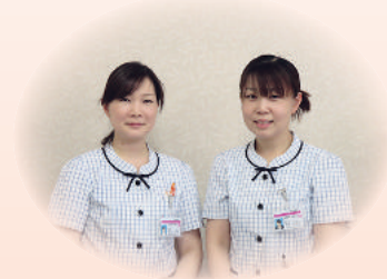
入退院支援センター

指し、O F J T研修会等を開催し、その中で、安全管理や接遇向上に力を入れ、勉強会を行っております。患者さんと笑顔で接することができるように心がけ、今までの経験を生かし、患者さんをサポートし、患者さんと医療機関をつなぐ「架け橋」となるように努めてまいりたいと思いますので、どうぞよろしくお願いいたします。