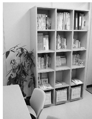
写真は患者さん向けの書籍やパンフレットの本棚です