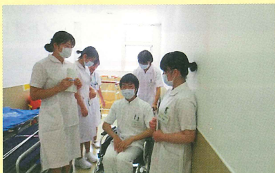
【車椅子を実際に押してみる】