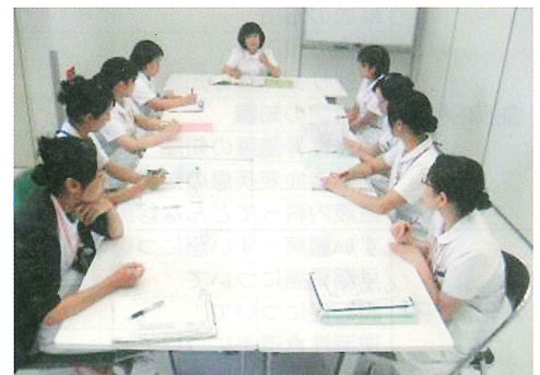
月に一度、認定看護師会を開催し、各担当の活動状況報告や情報交換を行っています。