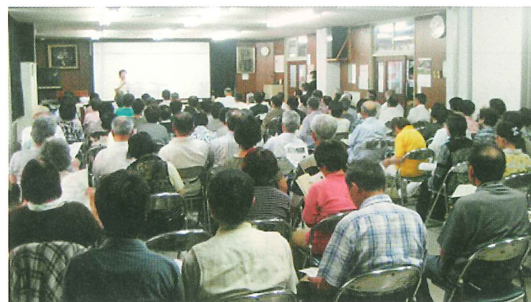
毎回多くの方々に参加いただいています。