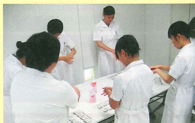
【手指衛生について学ぶ】

参加した生徒からは、「改めて看護師になりたいという気持ちが強くなった」や「想像していたよりも大変だと思ったが、やりがいがあると感じた」という声が聞かれました。中には「ベッドメイキングなど、実際に体験してみて、とてもよい時間を過ごす事が出来た」といった声もあり、普段経験することの出来ない体験を通して、様々なことを学んでいただきました。