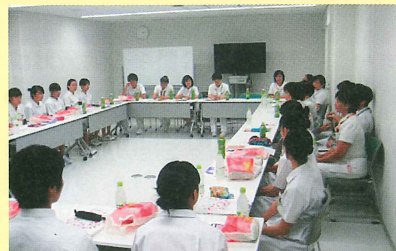
【一日看護体験を終えて…】